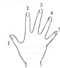
Dedos de la mano derecha